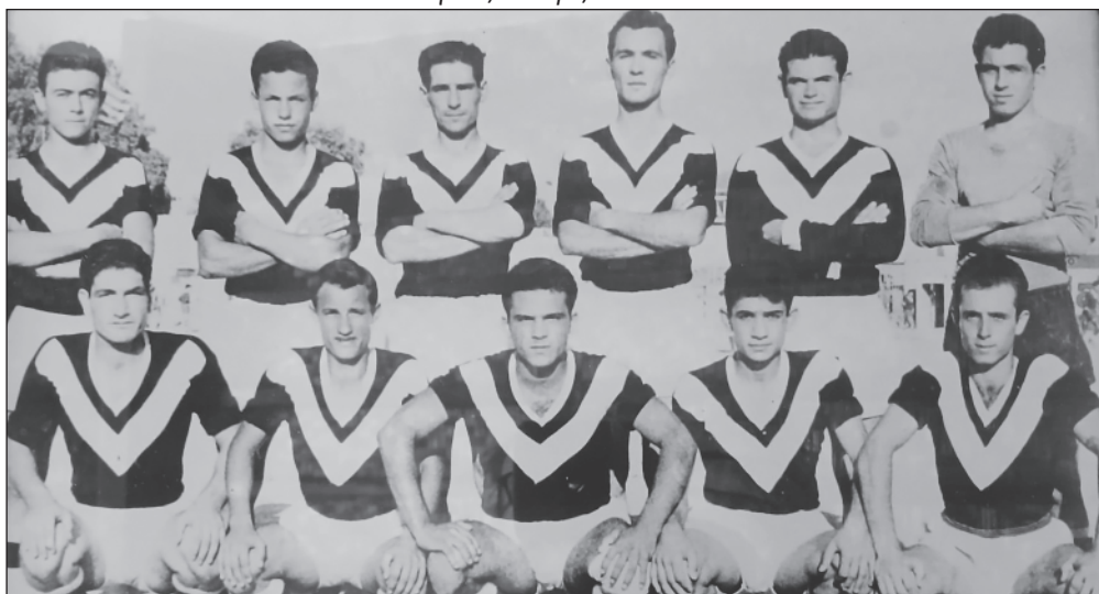
Αθλητικός Σύλλογος «Απόλλων»