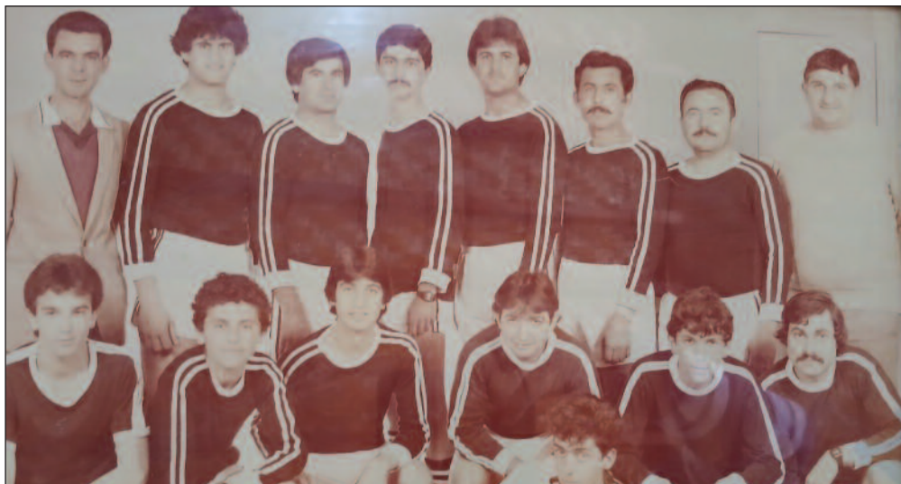
Αθλητικός Σύλλογος «ΠΡΟΟΔΟΣ»